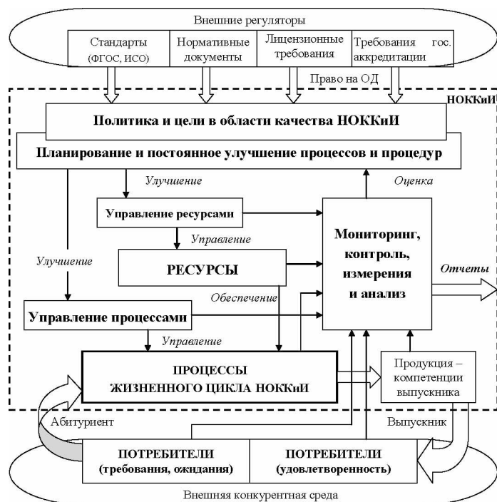
Таблица 27. Распределение ответственности за виды деятельности и процессы