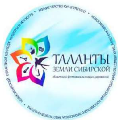
Рис. 1. Значок с фирменным стилем фестиваля

Для фестиваля были разработаны: фирменный стиль (баннер, грамоты, значки), слоган: «Таланту не прикажешь где родиться», элементы декорации (большая лира как символ искусства). Все это стало достойным украшением праздника.