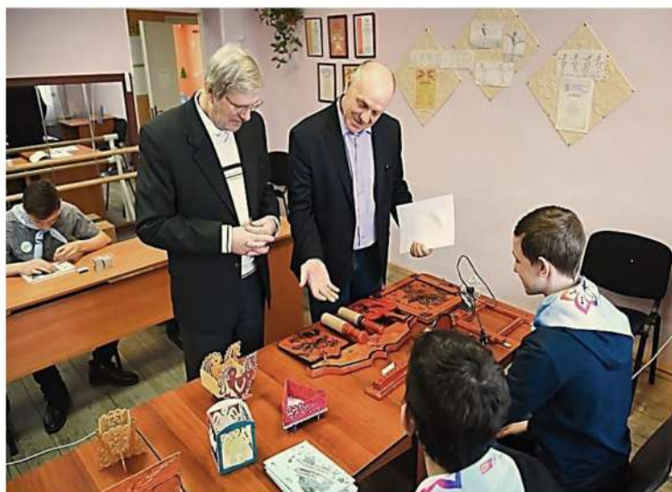
Рис. 4. Участники и жюри фестиваля в Кыштовском районе. Номинация «Декоративно-прикладное творчество»

Данная технология мероприятия позволила провести плодотворную работу в самых отдалённых районах Новосибирской области. Главная особенность фестиваля «Таланты земли Сибирской» в том, что специалисты проводили прослушивание молодых дарований не кустарным способом, то есть объединяя близлежащие районы на одной площадке, как это делается обычно на выездных конкурсах и фестивалях, а посещали каждый отдельный район, а также работали с местными властями культуры и главами районов по привлечению и доставке талантливых детей из самых отдалённых сёл района.