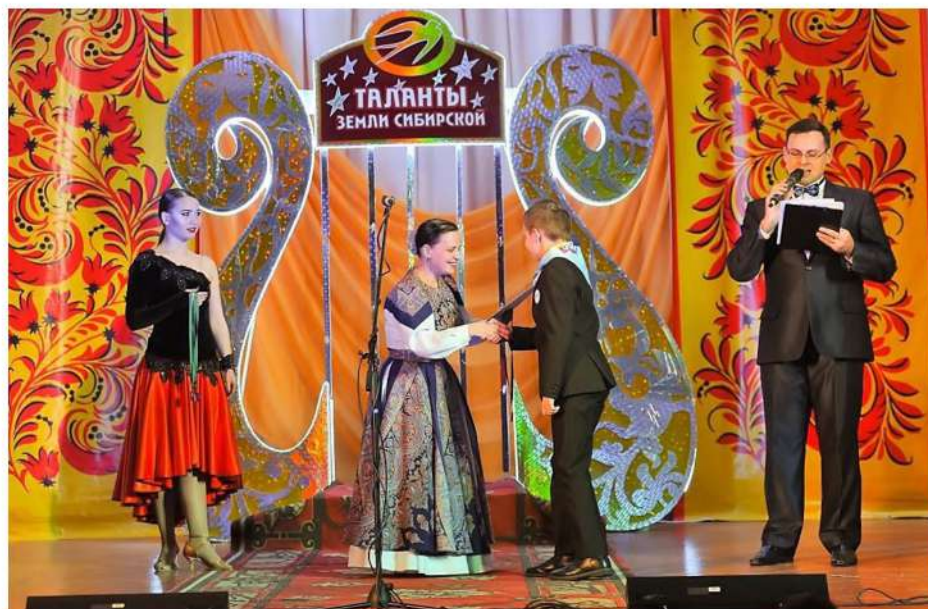
Рис. 5. Церемония награждения участников фестиваля в Кыштовском районе

Стоит отметить и оригинальное режиссёрское решение церемонии награждения участников фестиваля в районах Новосибирской области. После вручения памятных сувениров, медалей и благодарственных писем, все участники фестиваля совместно с преподавателями Новосибирского областного колледжа культуры и искусств, взявшись за руки, под финальную песню, выходили на сцену через лиру, установленную на сценической площадке. По задумке режиссёра лира – это символ, соединяющий все виды творчества. Данное действие символизировало вход каждого участника, проходящего сквозь лиру, в мир искусства и сопричастность к творчеству.