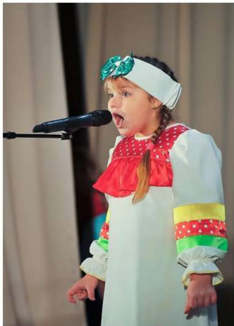
Рис. 3. Участница фестиваля «Таланты земли Сибирской» в Искитимском районе. Номинация «Вокал».

преподавателей и студентов Новосибирского областного колледжа культуры и искусств.