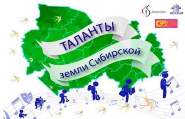
Рис.2. Баннер с фирменным стилем фестиваля

Фестиваль «Таланты земли Сибирской» поистине уникальный, прежде всего, из-за своей адресной направленности на детей и подростков, не имеющих возможности участвовать в творческих конкурсах, проводимых в городе Новосибирске и за пределами региона. Сложная, но интересная технология проведения фестиваля предполагала просмотр сольных и дуэтных творческих номеров участников, проведение мастер-классов ведущими преподавателями колледжа для педагогов детских школ искусств и руководителей творческих коллективов и церемонии награждения участников фестиваля в каждом районном центре с участием членов жюри-